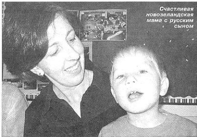
Счастливая новозеландская мама с русским сыном

Вот так, всем миром и согреваются детские души.